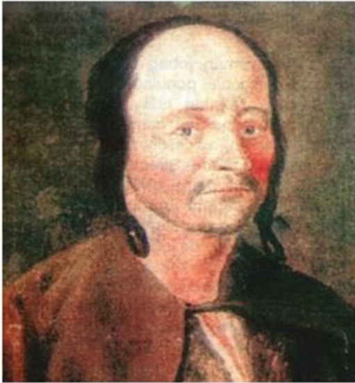
Vasile Ursu Nicola (Horea)